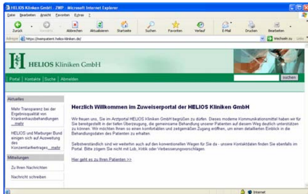
Startseite des Ärzteportals

Im HELIOS Ärzteportal werden den einweisenden oder anderen weiterbehandelnden Ärzten Behandlungsunterlagen in elektronischer Form bereitgestellt. Die Ärzte erhalten so aktuellere und ausführlichere Informationen zu Ihren Patienten. Diese Daten können die Ärzte direkt in Ihre Praxissysteme einbinden, so dass immer ein schneller Zugriff auf die Behandlungsergebnisse des Klinikums möglich ist.